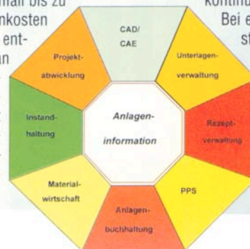
Struktur des Anlagen-Informations-Systems AIS von Merck

worbenes Know-how konsequent nutzen. Hilfreich ist dabei, dass Merck mittlerweile jede Instandhaltungsmaßnahme der jeweiligen Anlage bzw. der jeweiligen Teilanlage zuordnen kann – bislang war nur eine Zuordnung auf Kostenstellen möglich. „Dadurch kann für Bauteile mit kurzen Verschleißzeiten schnell eine Instandhaltungshistorie aufgebaut werden. Diese Daten können als Benchmarks für jede neue Instandhaltungs-Maßnahme herangezogen werden. Wir sehen darin die Grundlage für kontinuierliche Verbesserungen. Bei etwa 100 Millionen Euro Instandhaltungskosten pro Jahr erwarten wir auch hier Einsparungen.“