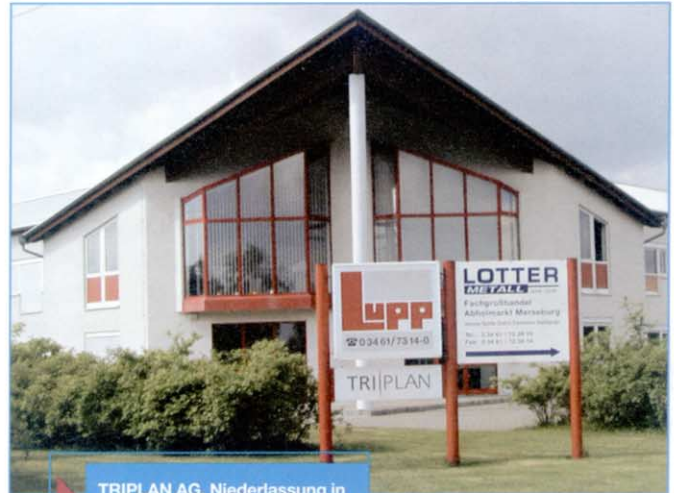
TRIPLAN AG, Niederlassung in der Merseburger Brandisstraße

Seit 1995 ist die Niederlassung in Merseburg,