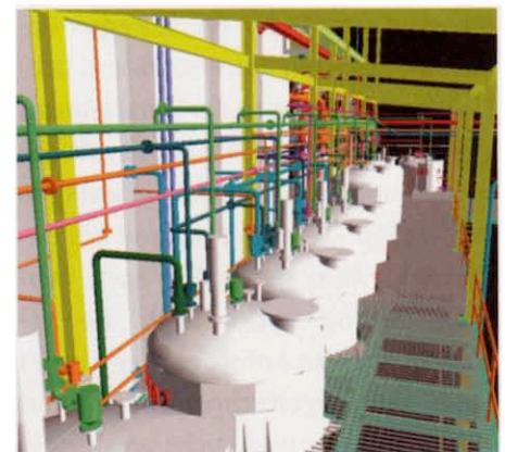
Rohrleitungen und Behälter zur Lagerung von Ausgangs-, Zwischen- und Endprodukten dominieren eine Biodiesel-Anlage. Für solche Projekte ist die Anlagenplanungs-Software Cadison bestens geeignet

Ein weiterer Vorteil der Semi-batch-Technologie: Sie ist nicht auf einen einzigen Rohstoff beschränkt, wer mit Raps begonnen hat, kann die AT-Anlage auch problemlos auf Altöle umstellen. „Sollte nicht genügend Rapsöl am Markt vorhanden sein oder zwingt ein hoher Preis den Betreiber zum Einkauf preiswerterer Öle, wie z.B. Altpflanzenöle, können diese ebenfalls problemlos verarbeitet werden. Hier sind